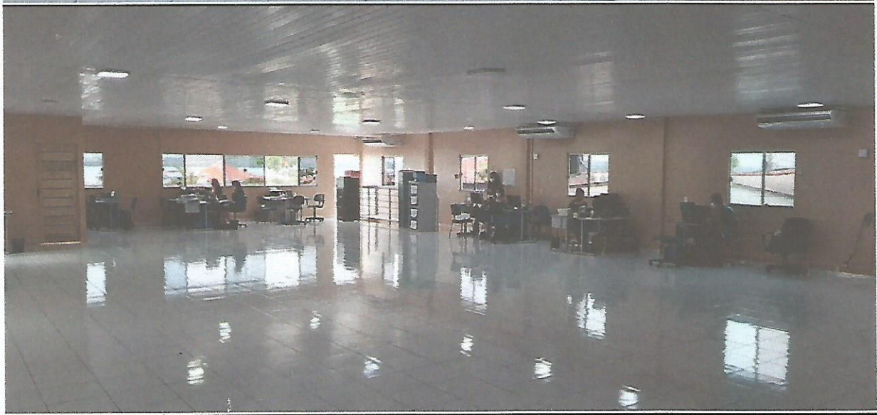
Foto do salão.